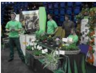
Foto: Hier z.B. „Der Bibelgarten“ für die Ansgar Kirchengemeinde in Kiel