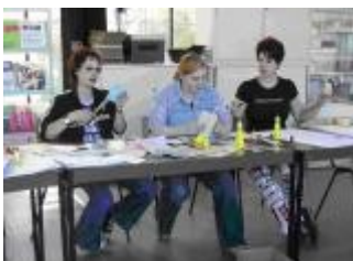
Foto: Hier z.B.: Ein Infostand über die Ausbildung zum Garten- und Landschaftsbauer auf der „Nordjob“ in Kiel