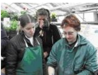
Foto: Hier z.B. eine Plakat- Gestaltung zum Thema: „Tag des Friedhofes“ auf dem Landesentscheid des Berufswettbewerbes für junge Gärtner